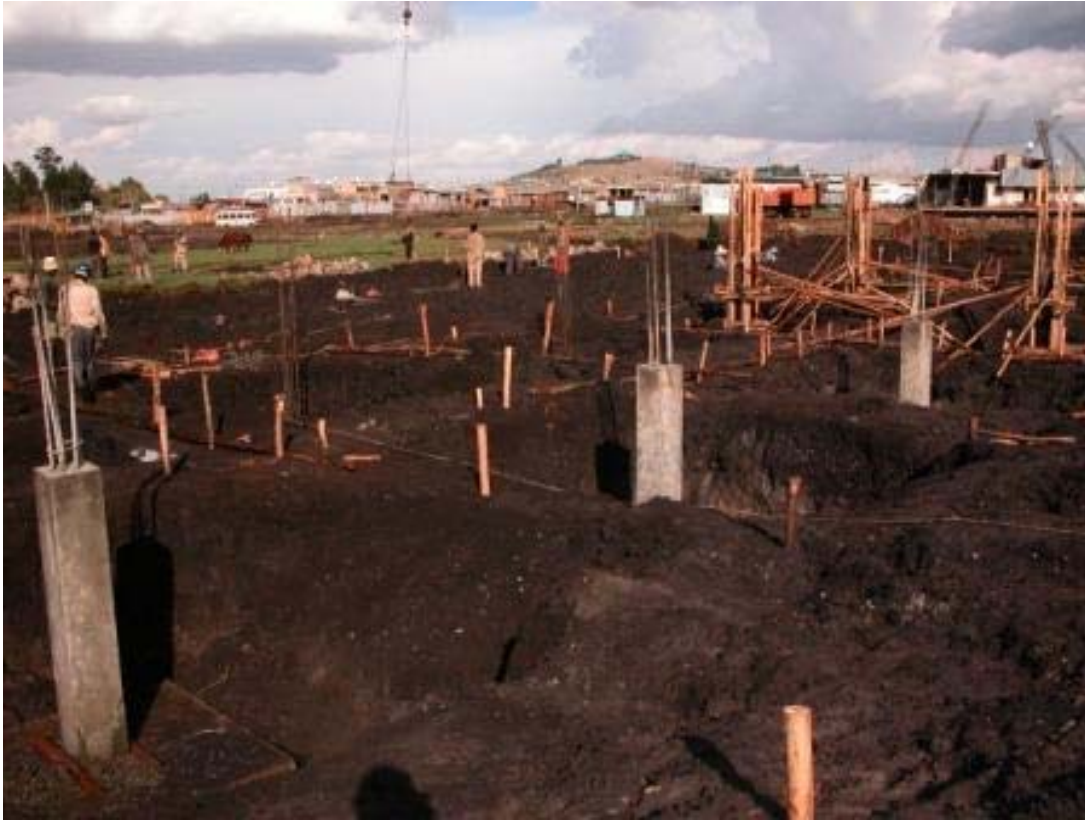
Staff Residence Building

Foundation slabs and columns underneath the groundfloor slab are being poured.