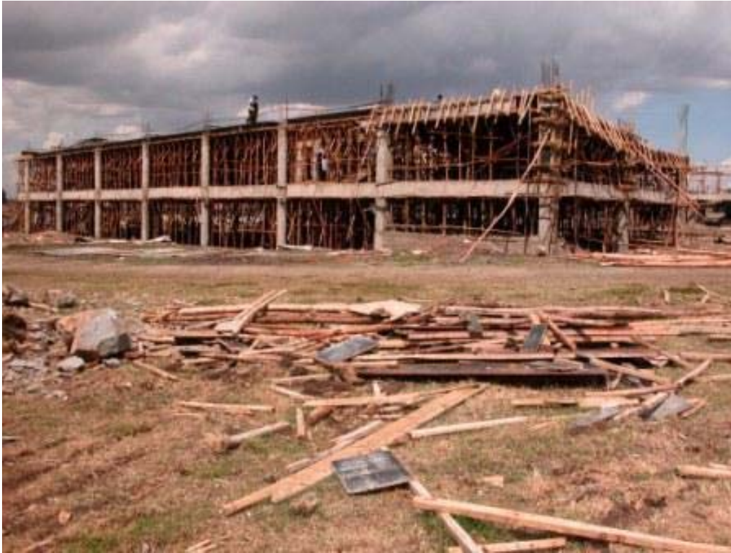
Classroom Building 1

The two classroom buildings each consist of a ground floor with three floors above. On this picture the ground floor and the first floor are ready and the steel fixers are busy fixing the reinforcement of the second floor. After steel fixing is finished, the second floor slab can be poured.