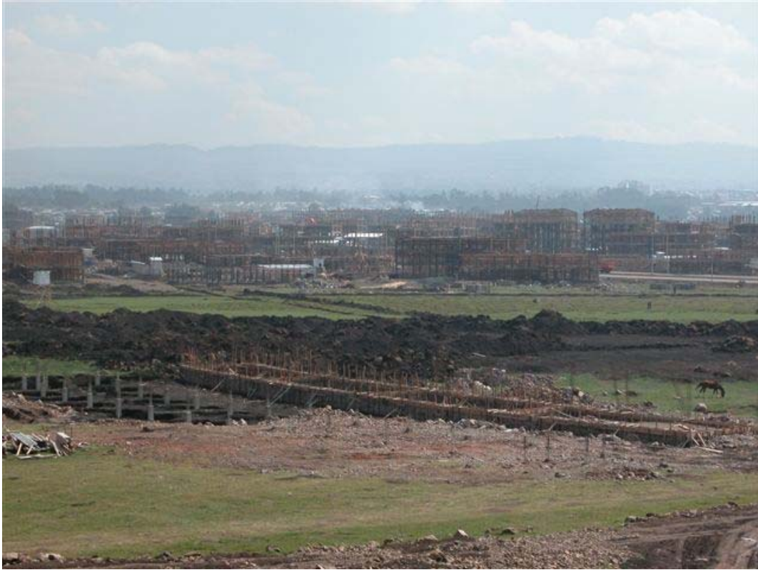
Staff Residence Building

Foundation beams to half the building are ready and the excavations of the foundation slabs of the other half are being backfilled.