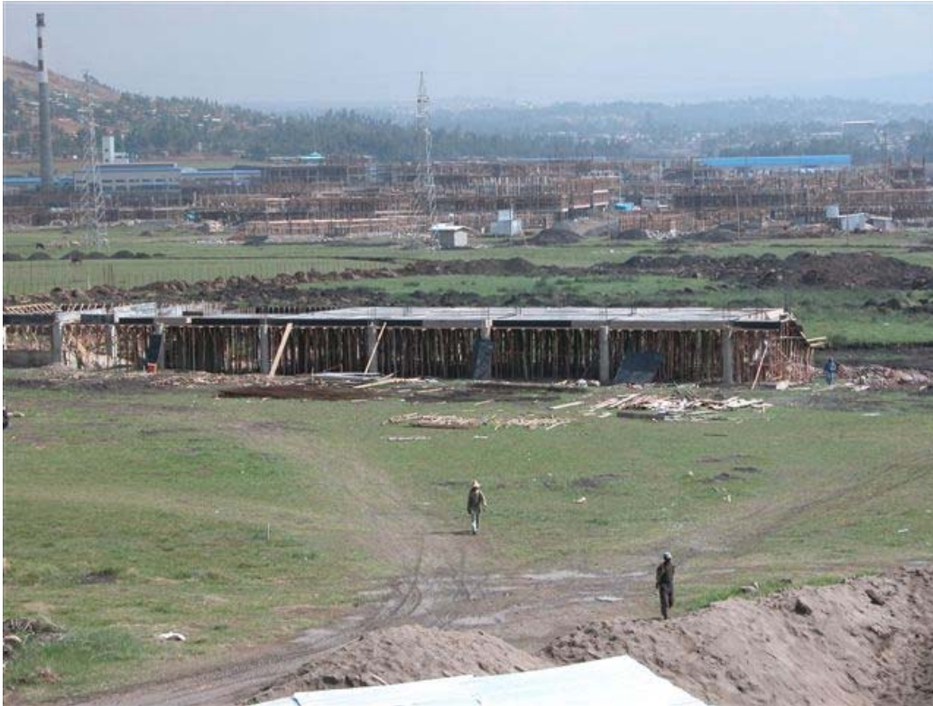
Classroom Building 2

The carpenters are busy with the formwork to the first floor.