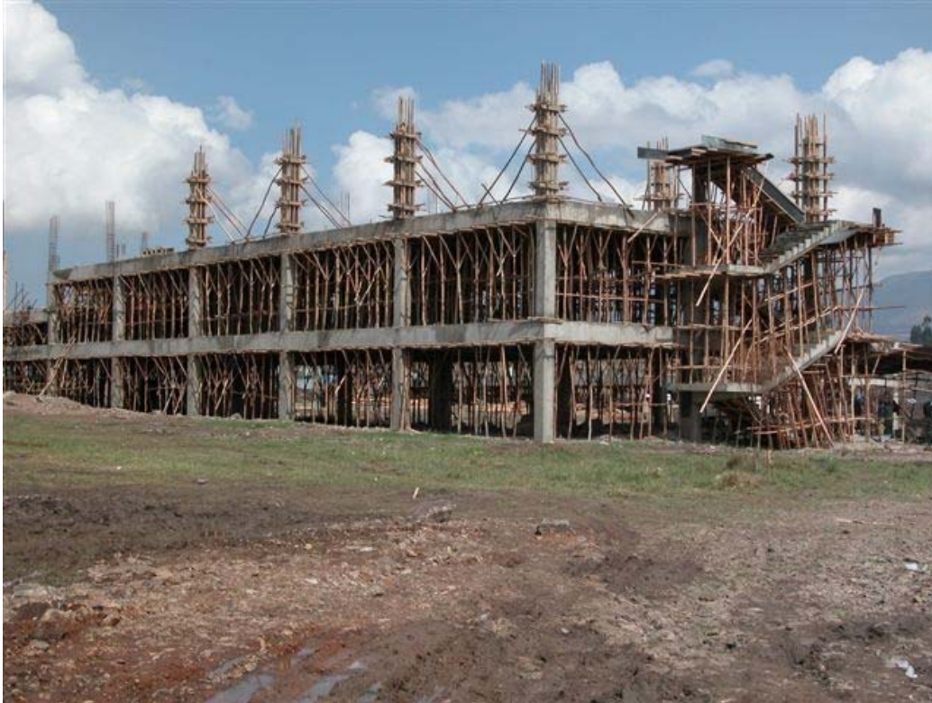
Classroom Building 1

The two classroom buildings each consist of a ground floor with three floors above. At this stage the ground floor, the first and the second floor are ready and the columns underneath the third floor are in progress.