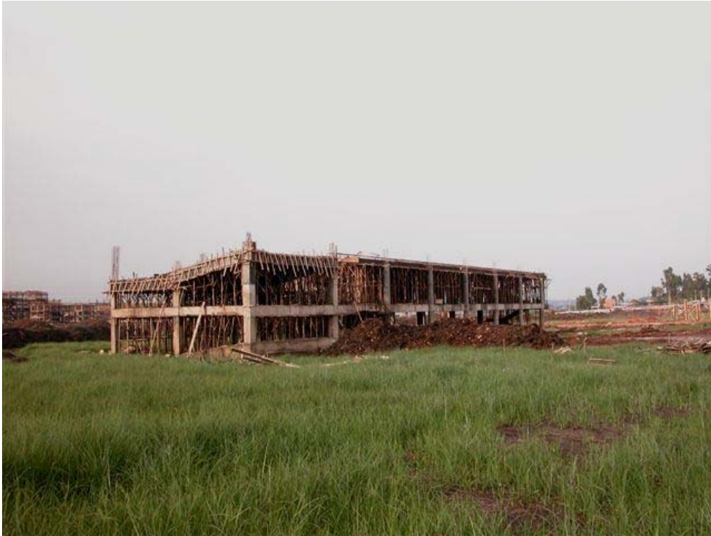
Classroom Building 2

The second floor (above the ground floor) of this building is almost ready.