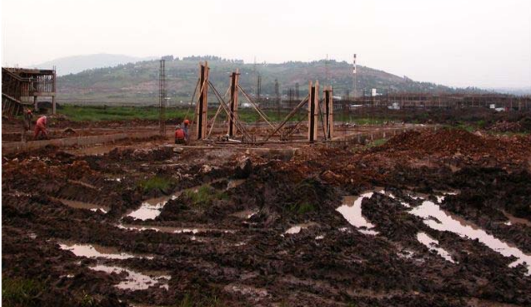
Staff Residence Building

The foundation is ready and the columns to the roof beam of the lower block are being erected. The Staff Residence Building consists of two blocks, one block with only a ground floor and 8 apartments and the second block consists of two floors with 16 apartments. The apartments are mainly meant for future staff personnel from abroad.