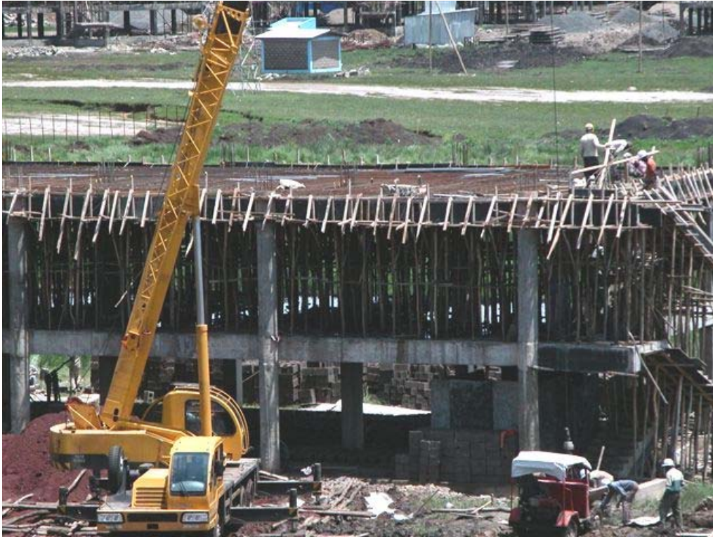
Classroom Building 2

The fixing of reinforcing steel is ready and the second floor can be cast.