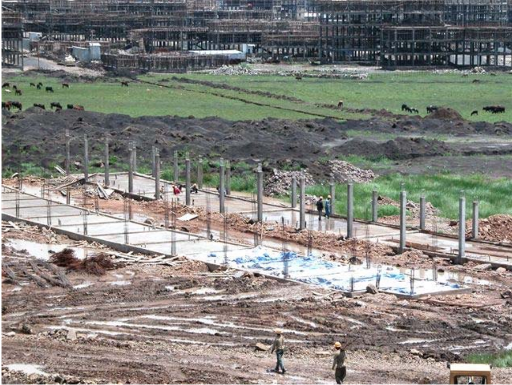
Staff Residence Building

This picture was also taken from the fourth floor of the classroom building. The blinding concrete to the first floor is finished and in the middle steel fixers can be seen fixing the reinforcement.