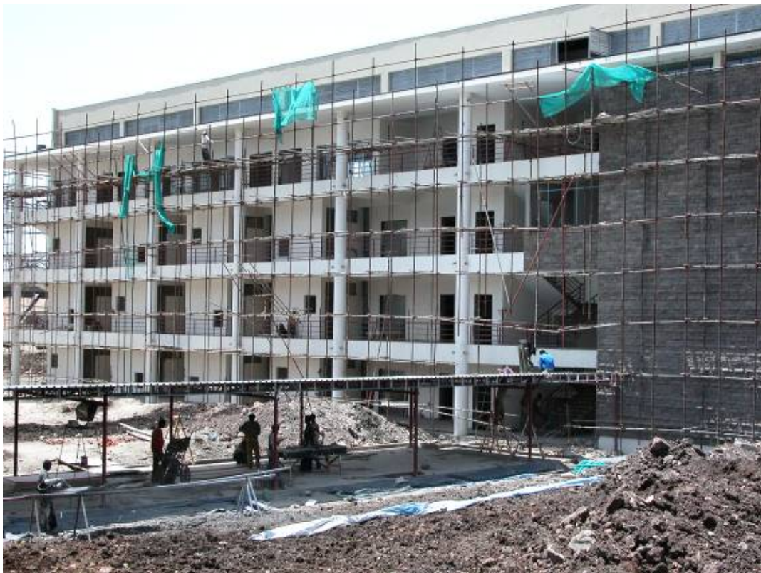
The northeast side of the Classroom Building. De noordoost gevel van de Classroom Building