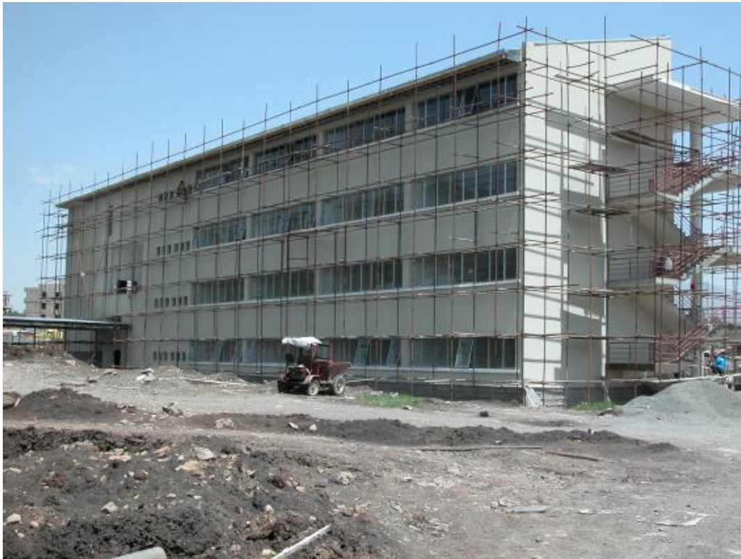
The southeast side of the Classroom Building. De zuidoost gevel van de Classroom Building.