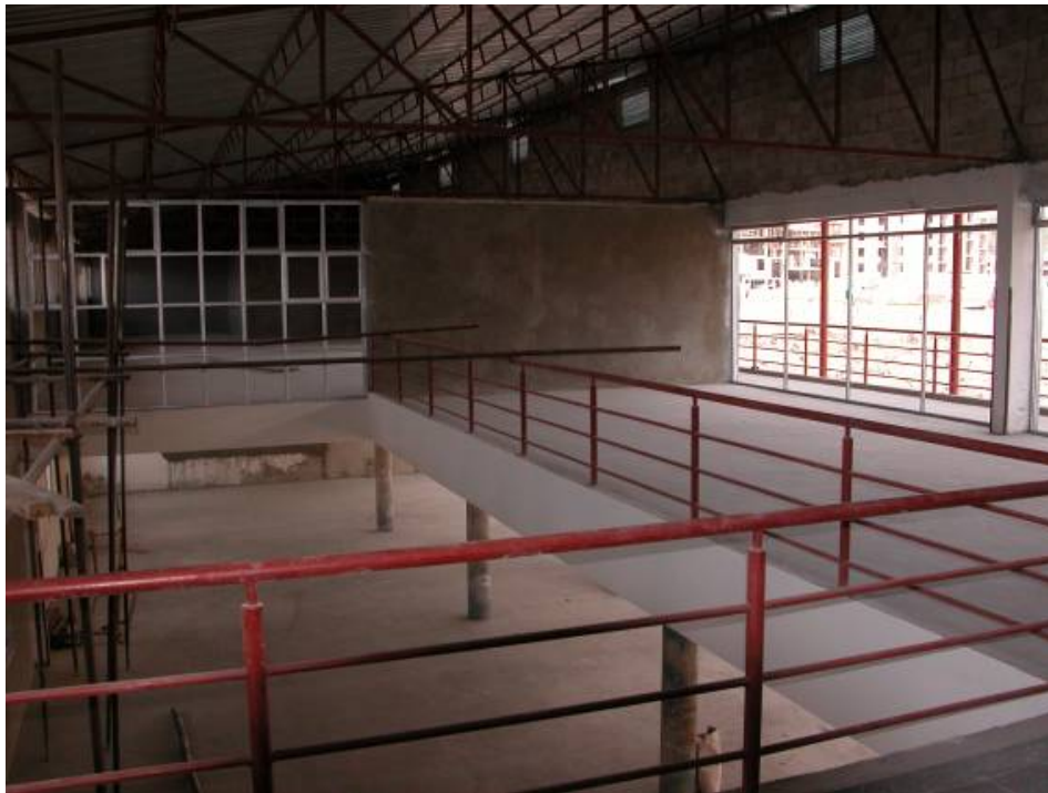
The teacher's restaurant on the upper floor with a view to the student's restaurant on the ground floor. Het leraren restaurant op de verdieping met een doorkijk naar het studenten restaurant op de begane grond.