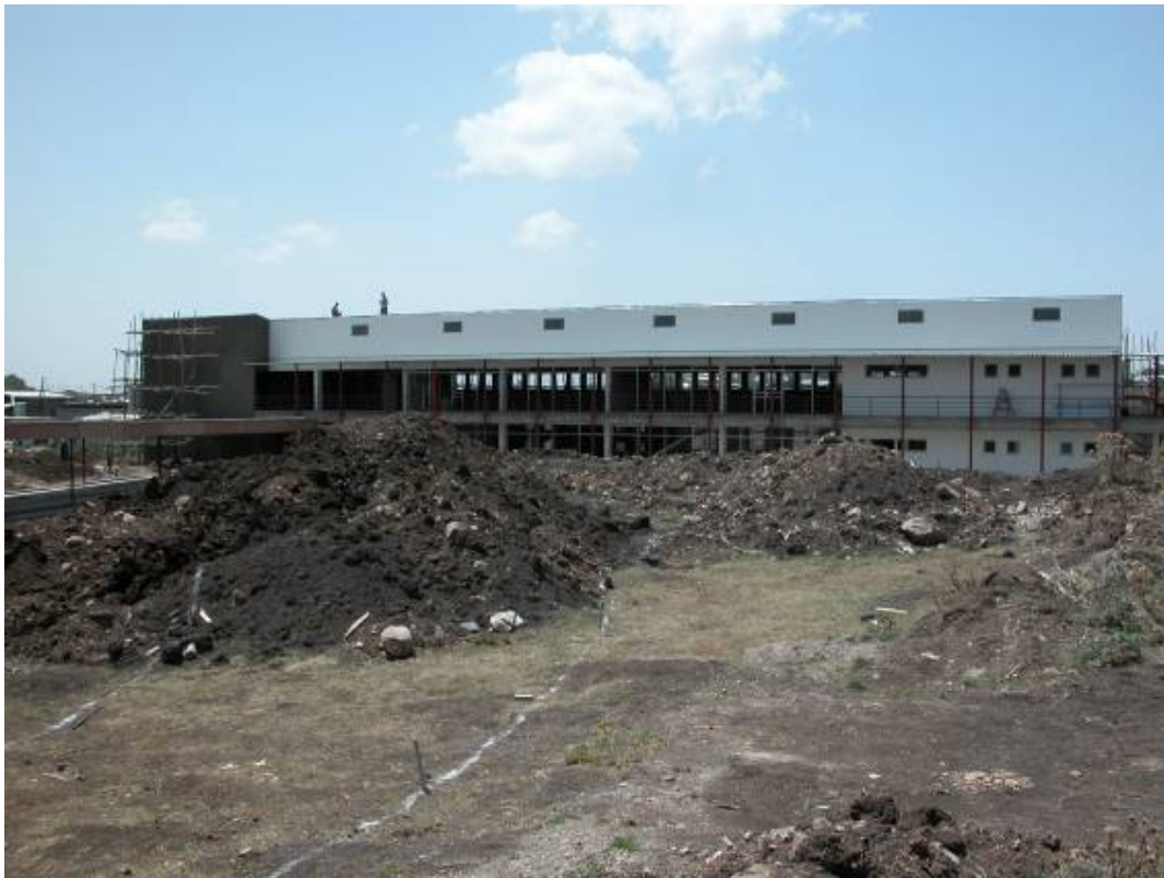
The northwest side of the Service Center. De gevel aan de noordwest zijde.