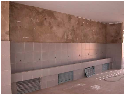
Hand wash basin