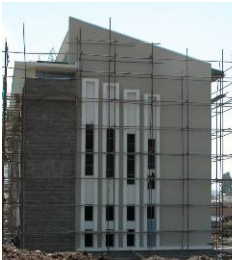
The southwest side. De zuidwest gevel.