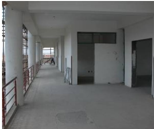
The walkway on one of the upper floors at the northwest side. De galerij op één van de verdiepingen aan de noordwest kant.