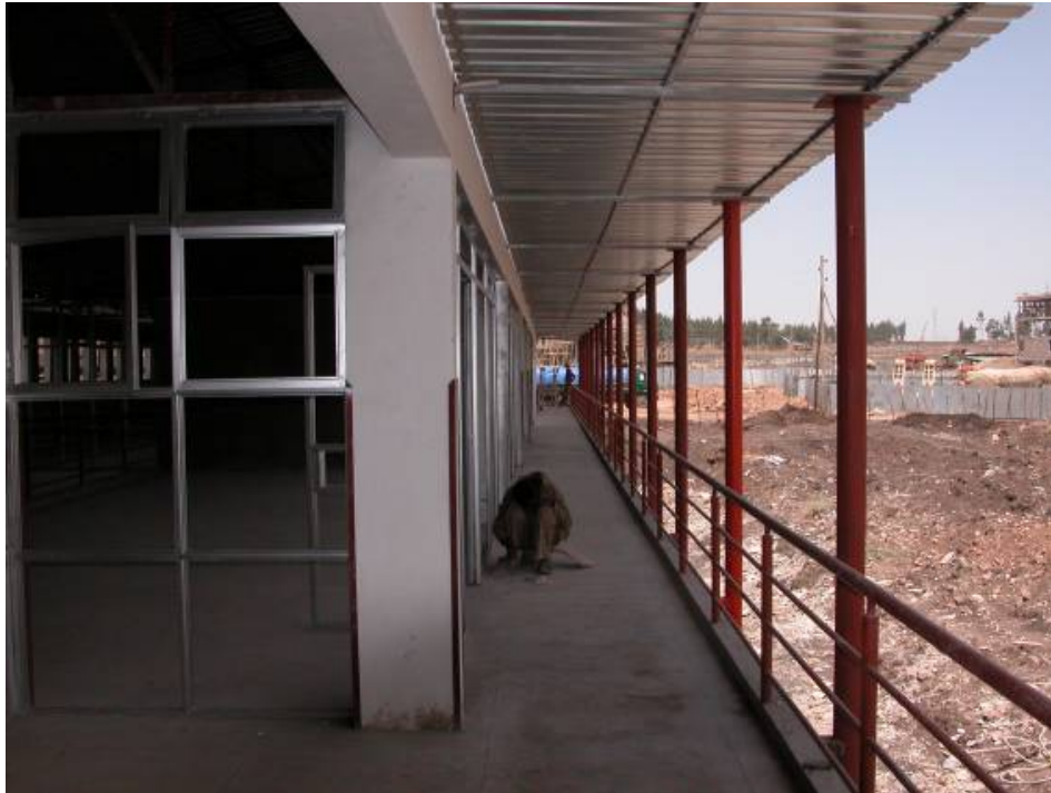
The walkway on the upper floor at the northwest side of the Service Center. De galerij op de verdieping aan de noordwest zijde van het Service Center.