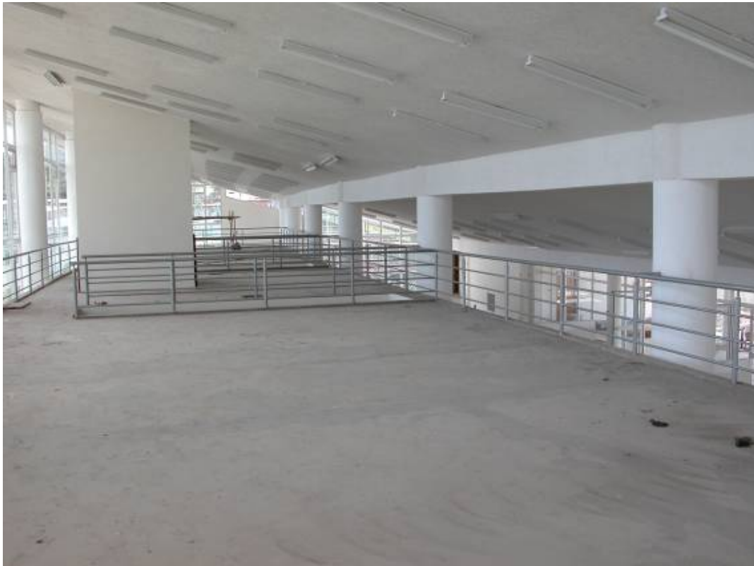
The mezzanine floor of the Library. De tussenverdieping van de bibliotheek