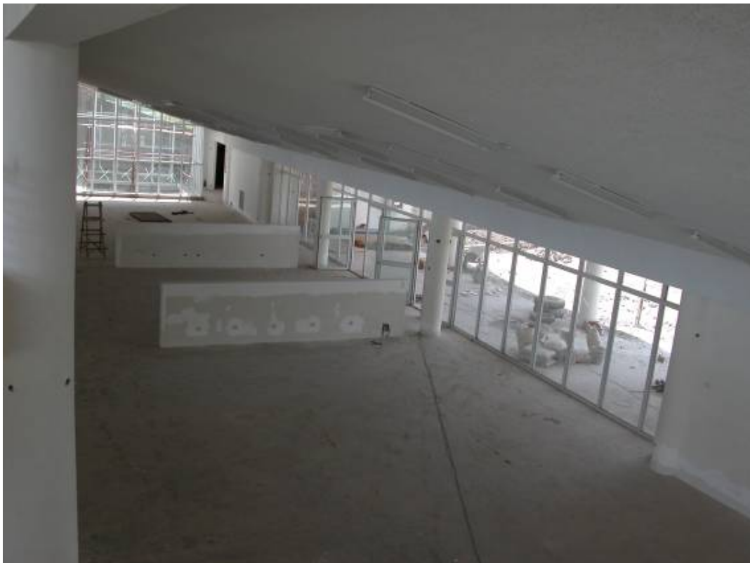
View from the mezzanine floor. Gezicht vanaf de tussenverdieping