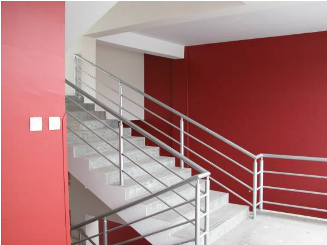
The corridor on the third floor and the staircase of the classroom building.

De gang op de tweede verdieping en het trappenhuis van het schoolgebouw.